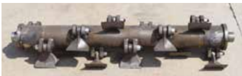
Standard Cod. 7012

TIPI DI ROTORI DISPONIBILI TYPES OF ROTORS AVAILABLE TYPES DE ROTORS DISPONIBLES TIPOS DE ROTORES DISPONIBLES ERHÄLTICHE ROTORVARIANTEN