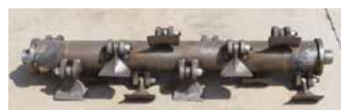
Standard Cod. 7012

TIPI DI ROTORI DISPONIBILI TYPES OF ROTORS AVAILABLE TYPES DE ROTORS DISPONIBLES TIPOS DE ROTORES DISPONIBLES ERHÄLTICHE ROTORVARIANTEN