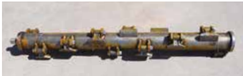
Standard Cod. 7008

TIPI DI ROTORI DISPONIBILI TYPES OF ROTORS AVAILABLE TYPES DE ROTORS DISPONIBLES TIPOS DE ROTORES DISPONIBLES ERHÄLTICHE ROTORVARIANTEN